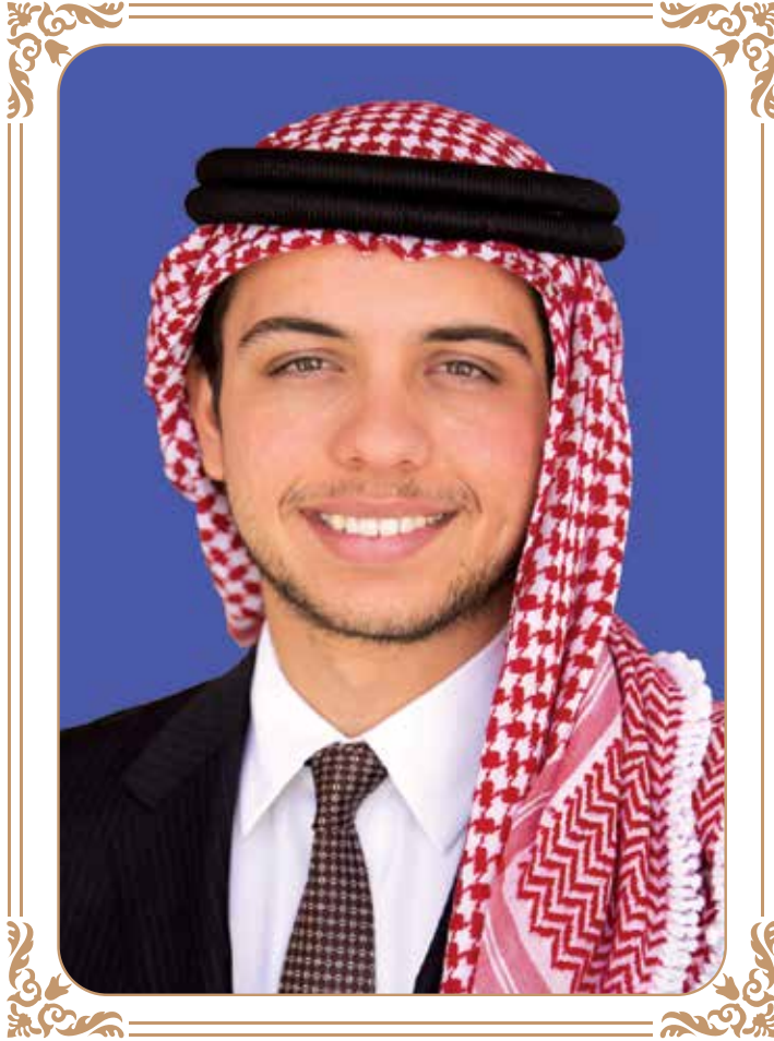
صَاحِبُ الشُّهُوبِ الْمَلِكِي الْأَشِيرُ الْحَسِينُ بْنُ عَبْدِ اللَّهِ الثَّانِي، وَرِثِيَ الْعَهْدَ الْمَعْظُمَ